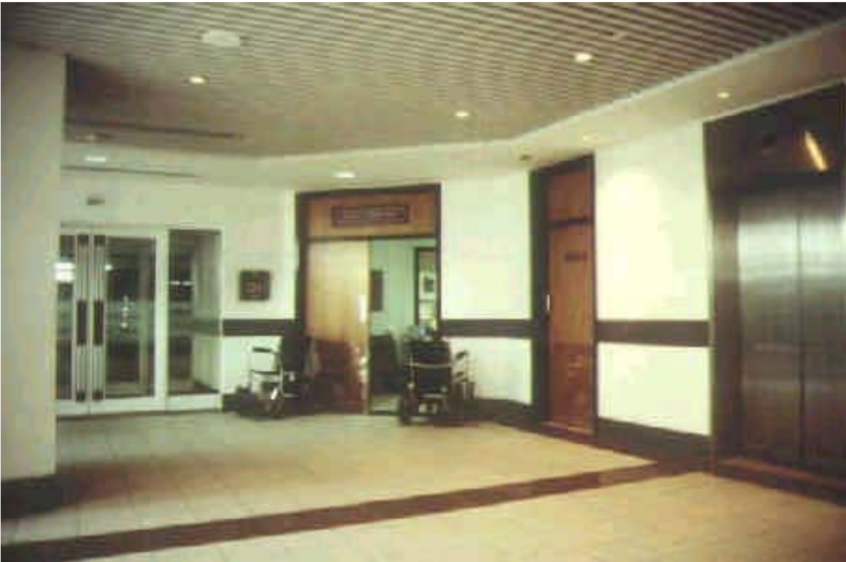
Un'immagine del centro di Shopmobility in Ipswich