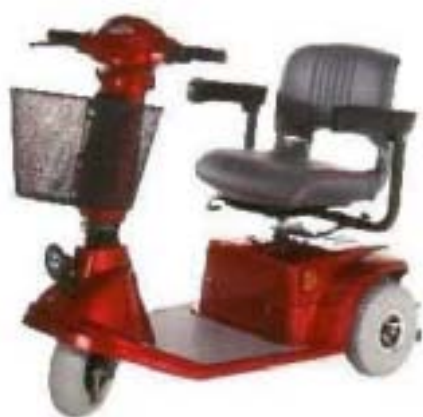
Esempio di un elettroscooter a 3 ruote