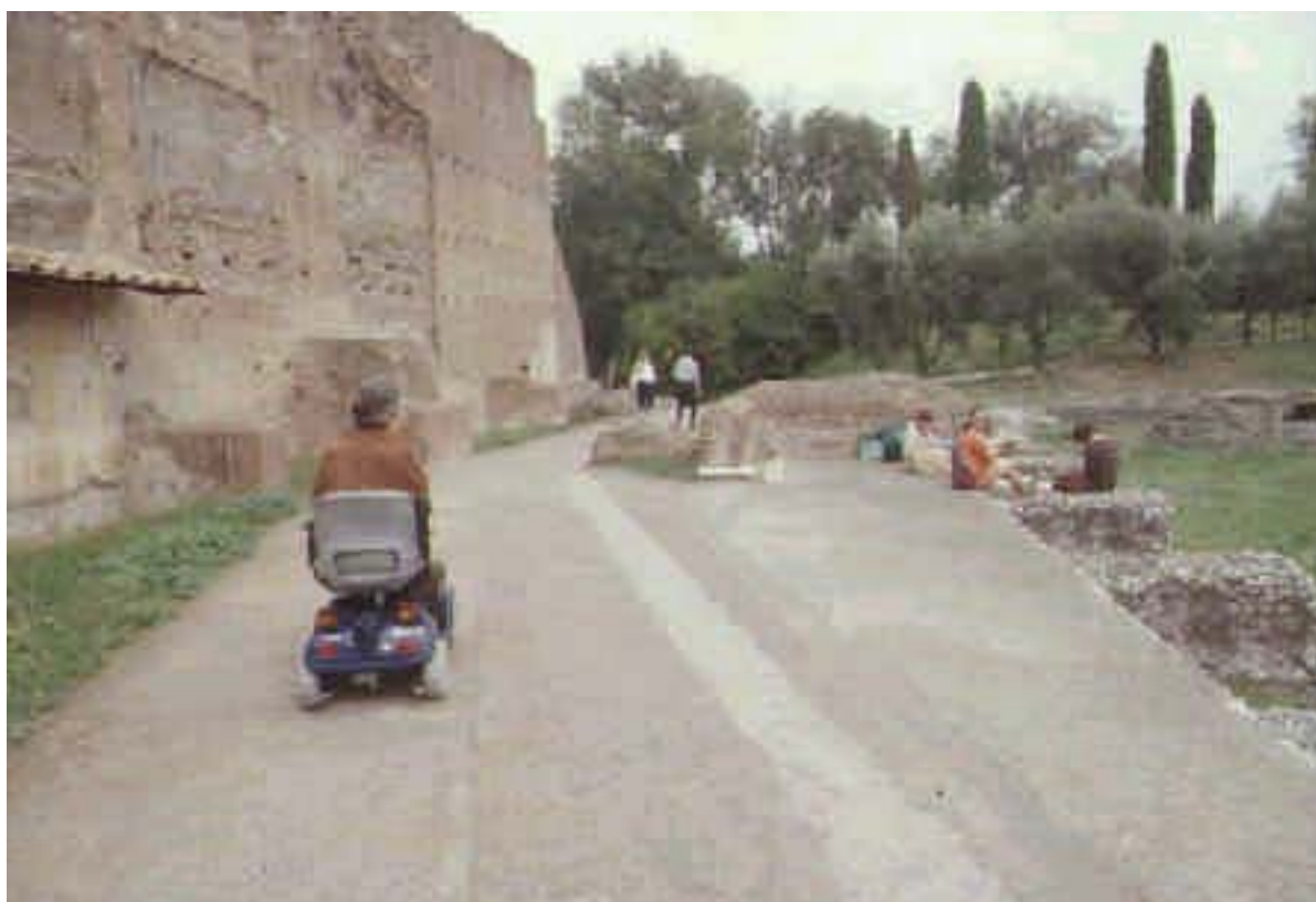
Esempio d'uso del servizio nell'area archeologica del Palatino